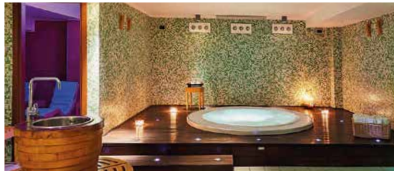
Ob im Relaxpool oder mit einem Eis in der Hand – genießen Sie kleine Auszeiten in Ihrem Urlaub