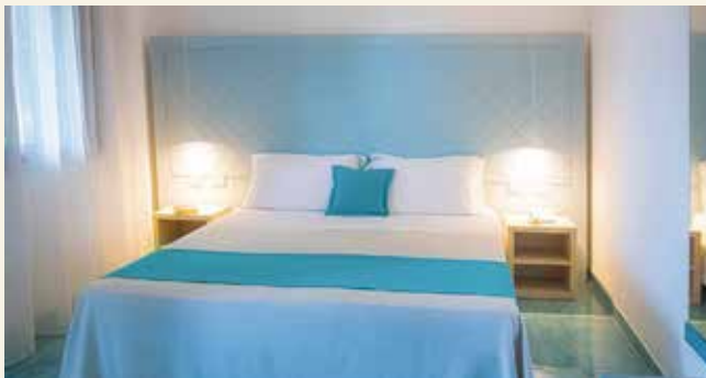
Wohlfühlen in renovierten Zimmern

Trivago: „Hervorragend“, Stand: April 2026