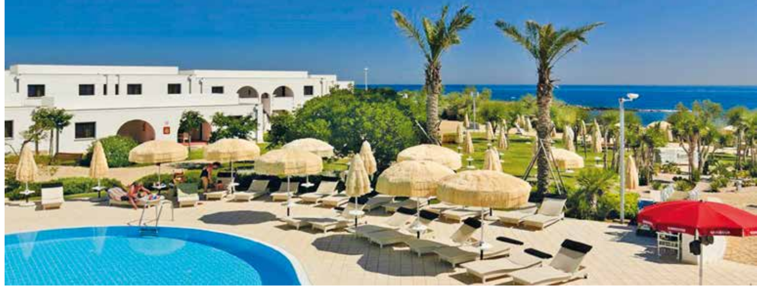
Entspannen Sie am Pool mit dem Meer in Reichweite