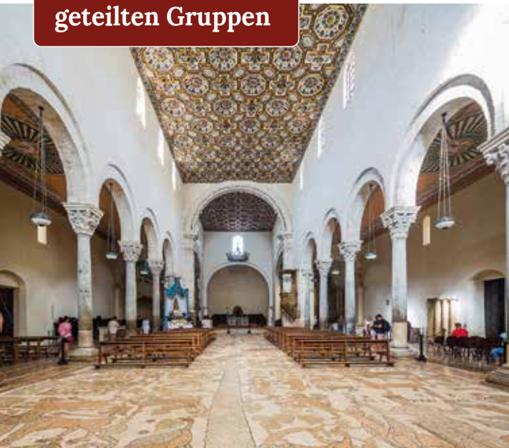
Orientalische Einflüsse in der Kathedrale von Otranto