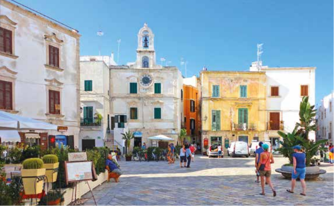
Mediterranes Flair im Zentrum unseres Urlaubsortes Polignano a Mare

INKLUSIVE Zwei Freizeittage an der Adriaküste