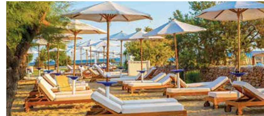
Bequeme Sonnenliegen zum entspannten Relaxen