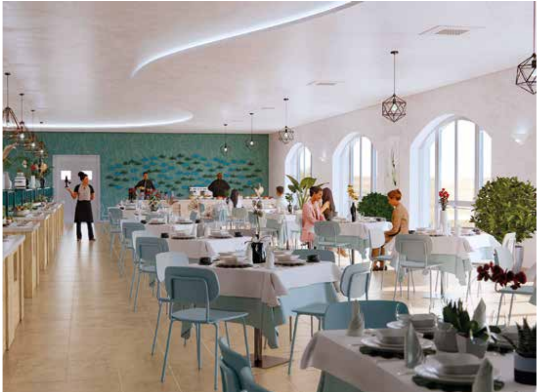
Helles Restaurantambiente für genussvolle Momente