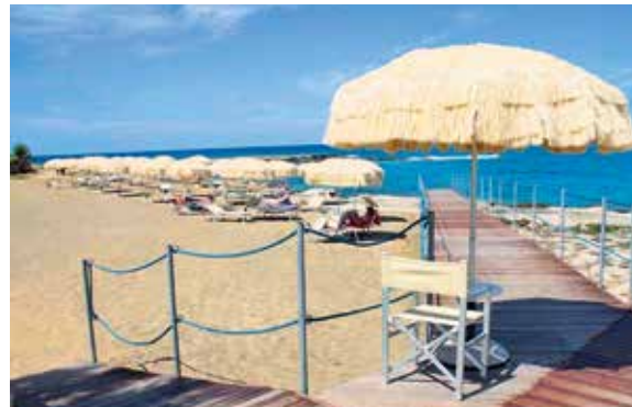
Badestege ermöglichen den Einstieg ins Meer