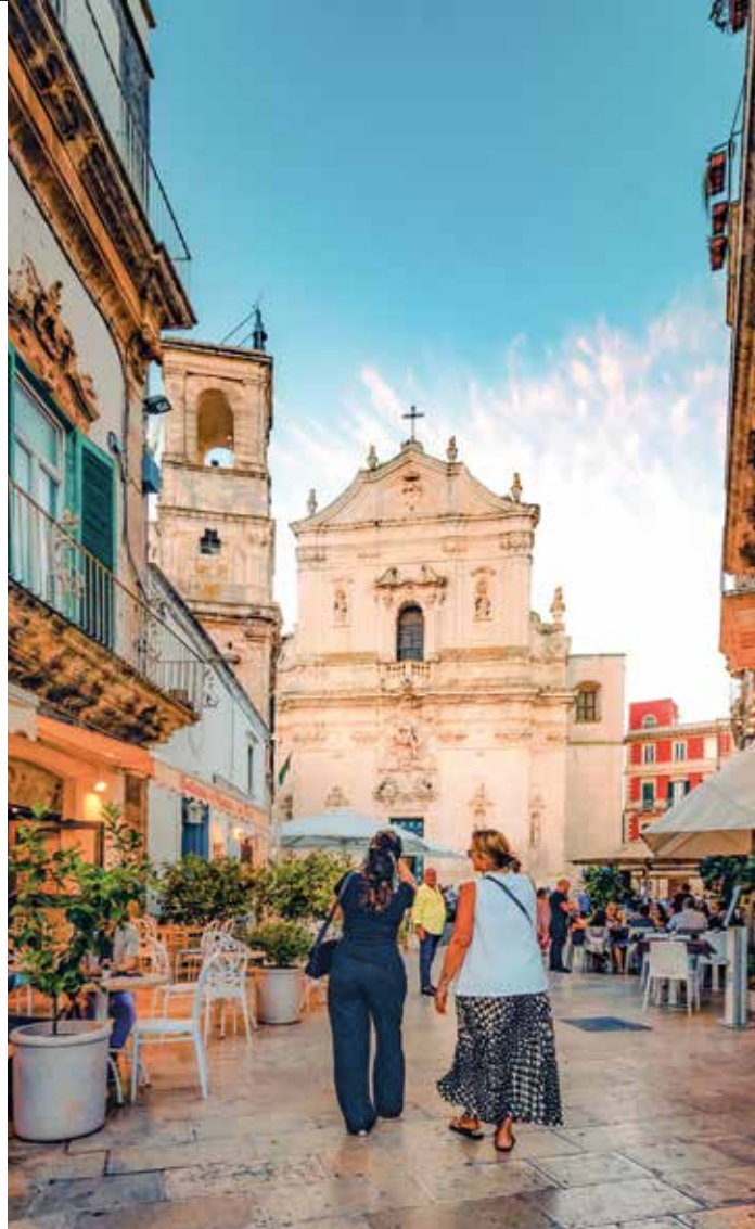
Martina Franca – Altstadt mit barocker Seele

Kegeldächer, so weit das Auge reicht: Die Trulli-Häuser wirken wie aus einem Märchen. Wir streifen durch die Stadt, vorbei an weiß getünchten Fassaden und kleinen bunten Läden. Zwischen den Hausreihen erzählen Steininschriften und Symbole von alten Zeiten und Bräuchen.