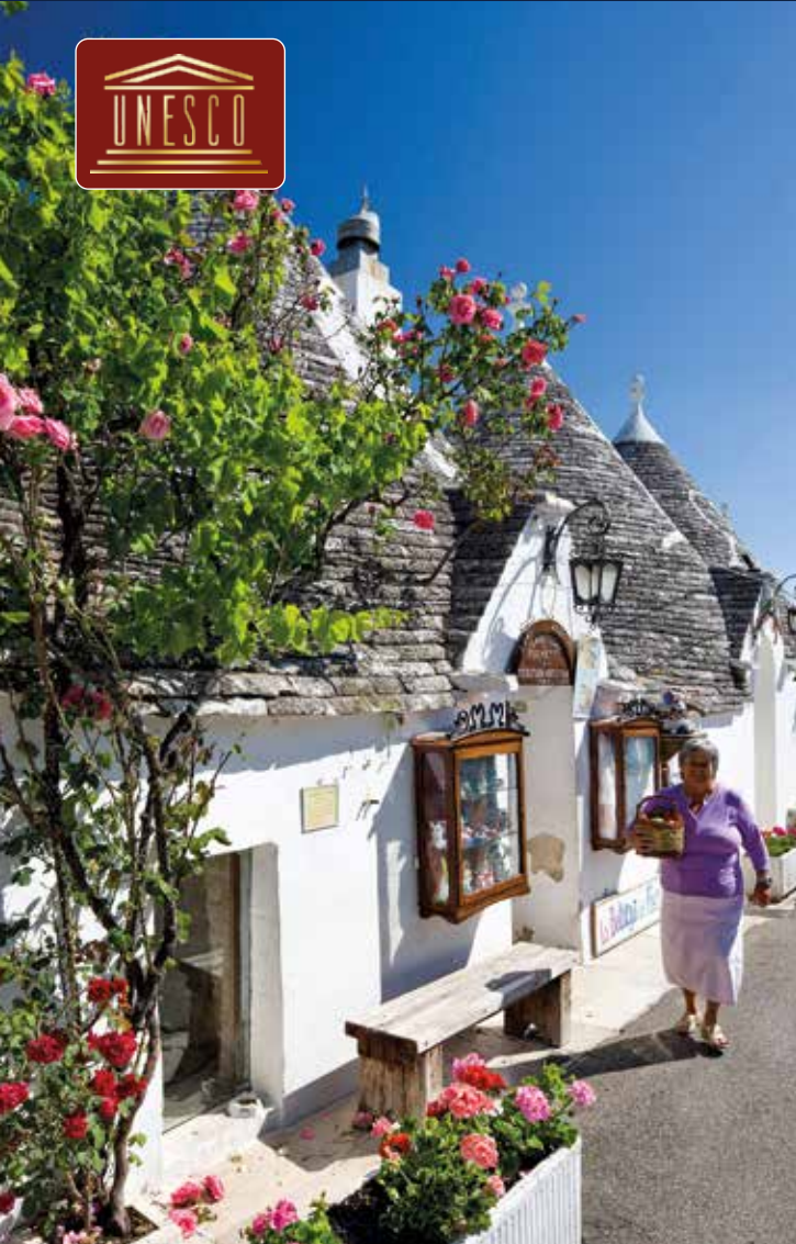
Alberobello – ein Dorf wie aus dem Bilderbuch