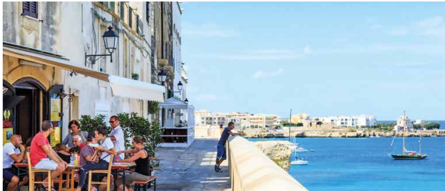
Freie Zeit in Otranto zum Flanieren – mit Meerblick und mediterraner Leichtigkeit